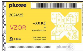
PLUXEE FLEXI PASS