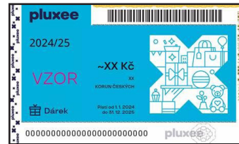
PLUXEE DÁRKOVÝ PASS