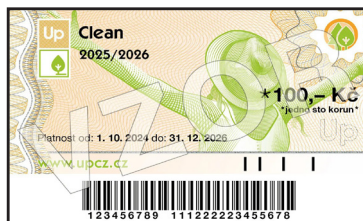
UP ŠEK DOVOLENÁ