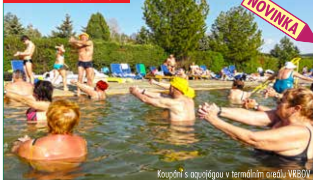
Koupání s aquajógou v termálním areálu VRBOV