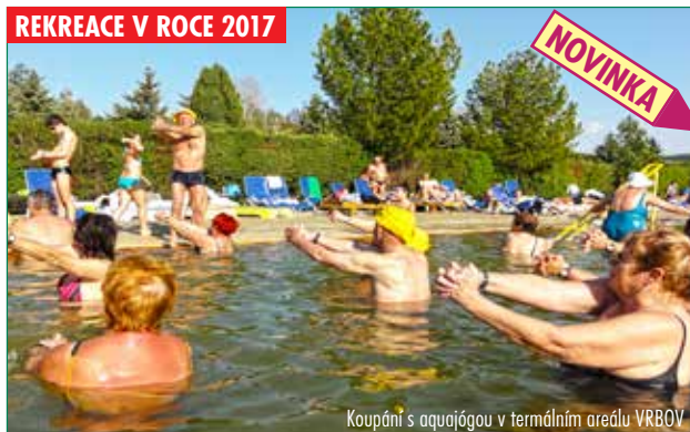
Koupání s aquajógou v termálním areálu VRBOV