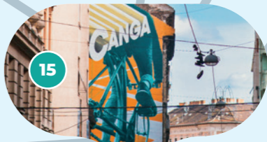
Budapeštský Mural art