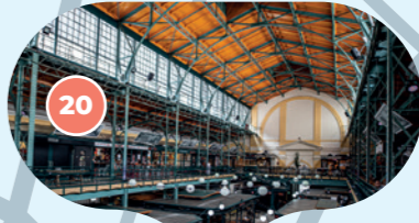
Trhy v centru města