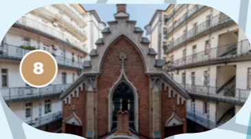
Synagoga v ulici Frankel Leó