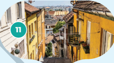
Ulice Gúla Baby