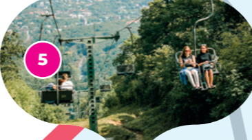
Sedačková lanovka Zugliget