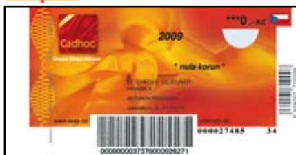
DÁRKOVÝ KUPÓN CADHOC

LÉ CHÉQUE DÉJEUNER Popis platných poukázek + další informace viz www.seky.cz